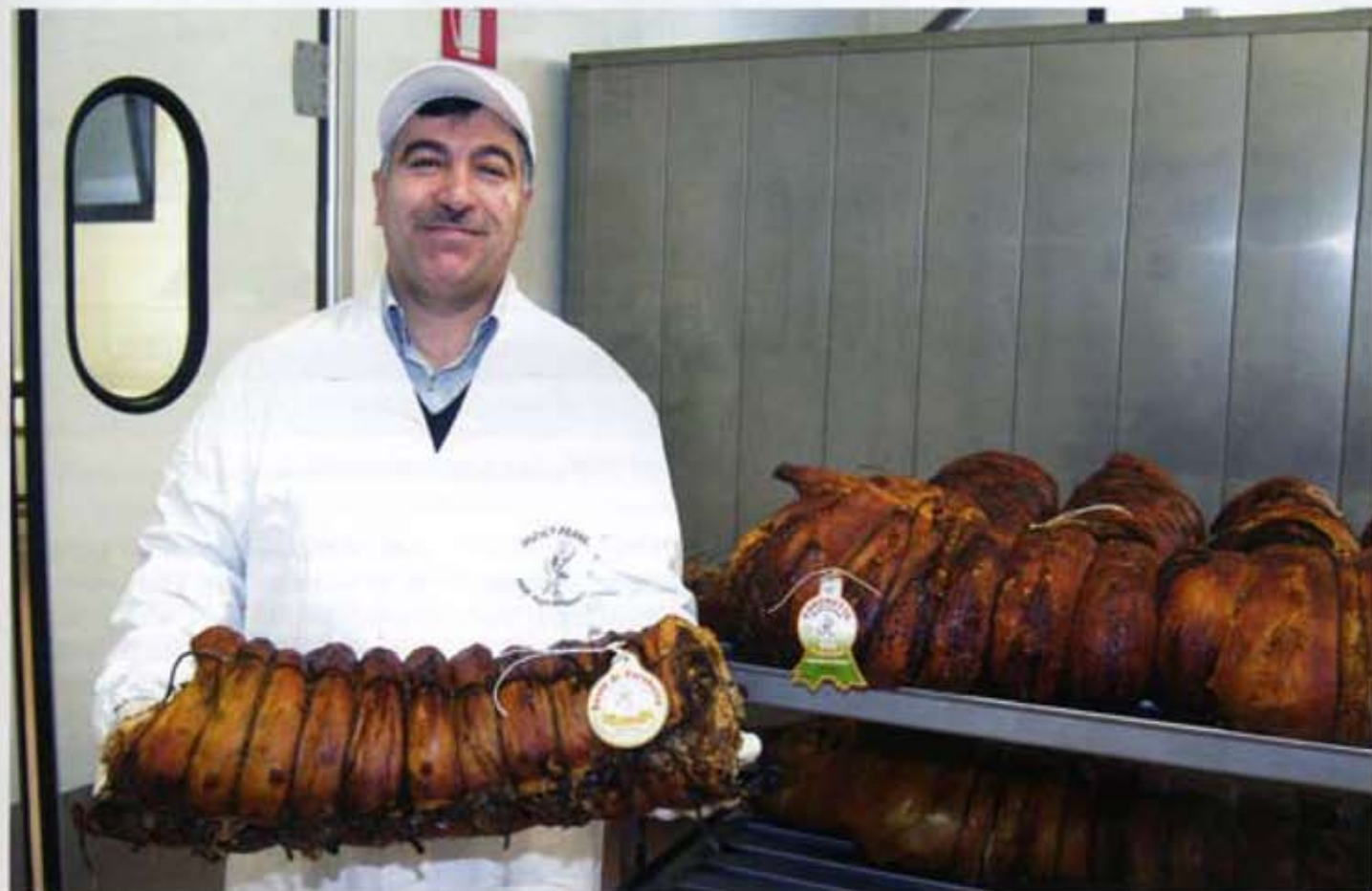
La porchetta della ditta "Francesco Mosca" è prodotta come una volta, con sapori antichi e una cottura esclusivamente arrosto.

a trasformarla in gustosa porchetta, cotta secondo le migliori tradizioni e con quei naturali aromi e condimenti che le conferiscono un inconfondibile sapore di buono, di genuino. Ecco, la nostra soddisfazione è proprio quella di offrire, ai tanti che ci scelgono e ci stimano, un prodotto di alta qualità, curato a mano, in ogni particolare. La mia porchetta, così come la voglio io, è